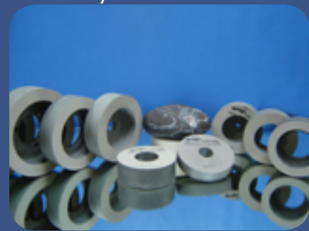
05 Black Panther